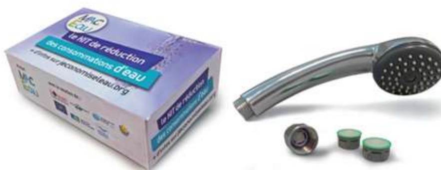
Kit hydro-économique « MAC Eau » distribué aux usagers

Ce sont 80 000 kits hydro-économiques composés de deux mousseurs et d'un réducteur de débit pour la douche qui ont été distribués gratuitement aux Girondins dans près de 60 000 logements. En échange, les abonnés s'engageaient à remplir une fiche de description de leur foyer, fournir leur facture d'eau et autorisaient le SMEGREG à récupérer leur consommation d'eau auprès du service d'eau potable pour analyse. La distribution a été menée à l'échelle des communes, ECPI et syndicats d'eau potable après une campagne de communication du département de la Gironde.