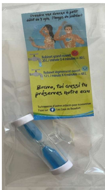
Sablier de douche distribué au public