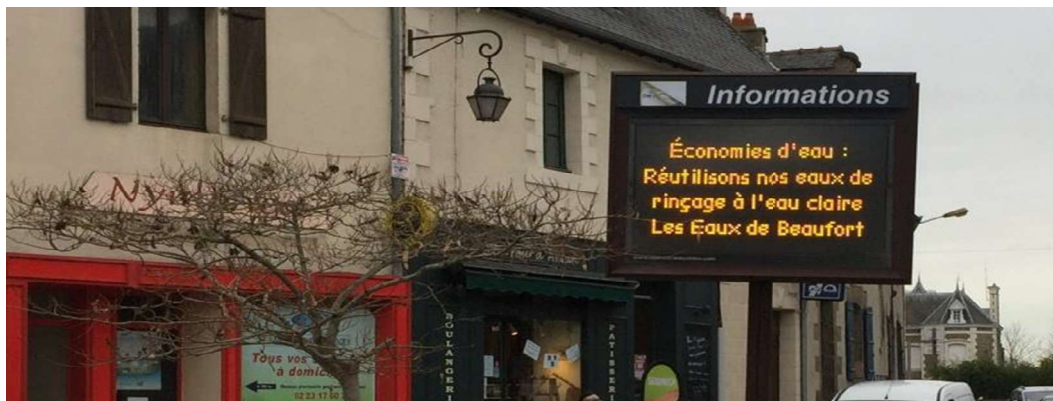
Message de sensibilisation en période de stress hydrique

Enfin, en période de stress hydrique, les panneaux lumineux des communes et la presse affichent des gestes simples d'économies d'eau. Des alertes ciblées (SMS, mail, téléphone) sont envoyées aux usagers dans les secteurs les plus critiques.